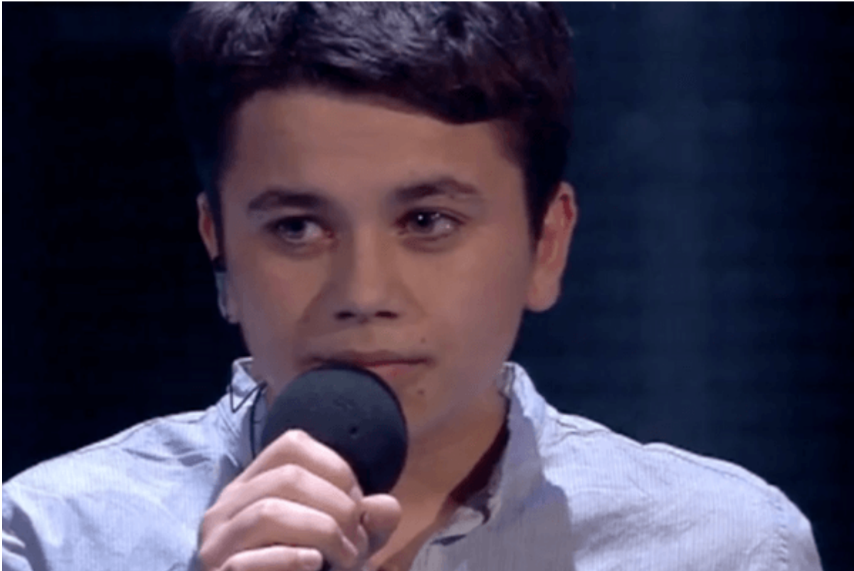
kadr z programu "Mam talent"