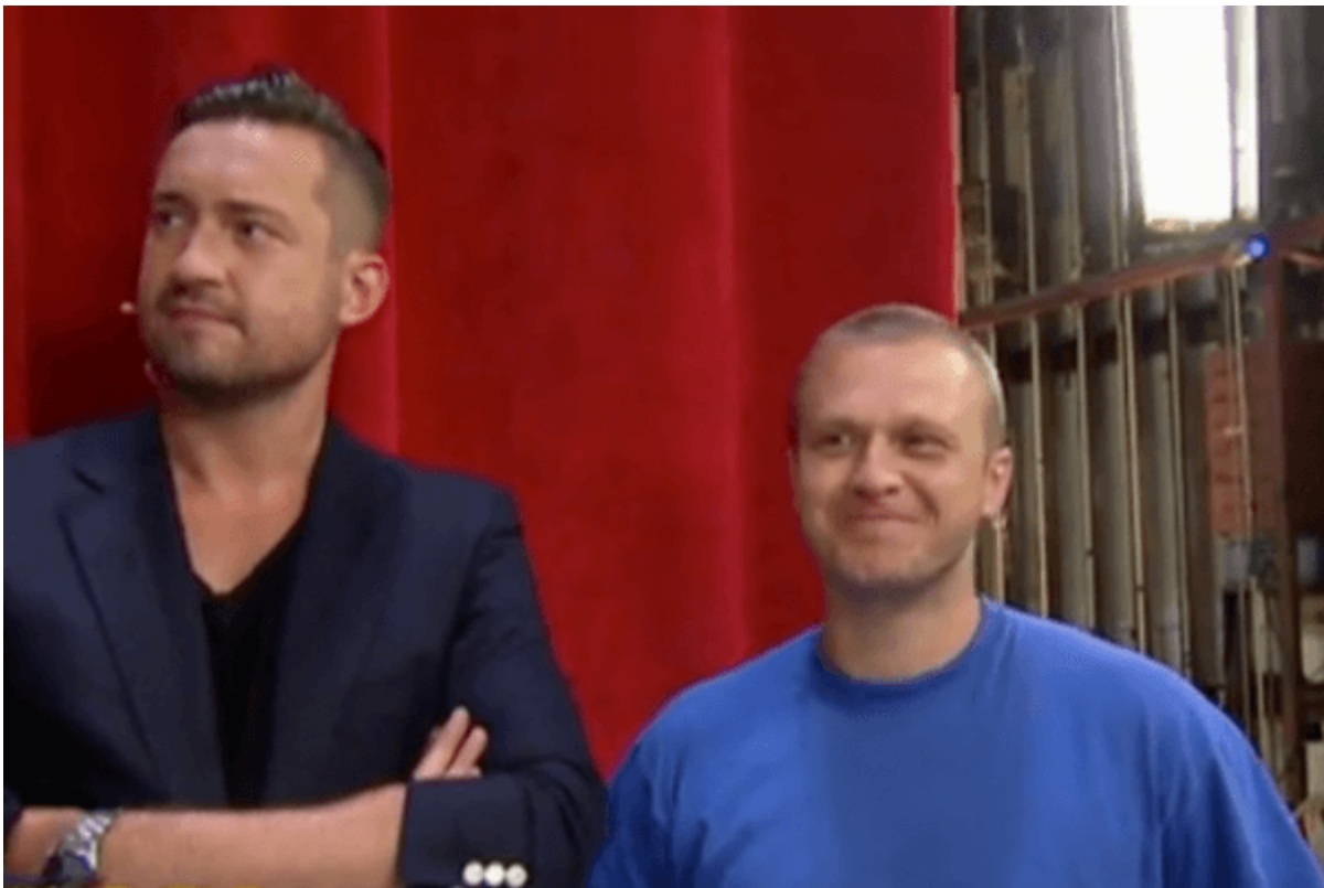
kadr z programu "Mam talent"