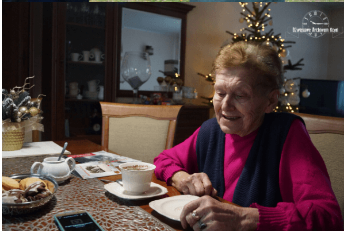
Pomagam zachować pamięć